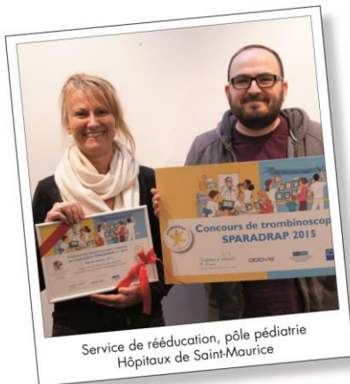
Service de rééducation, pôle pédiatrie Hôpitaux de Saint-Maurice