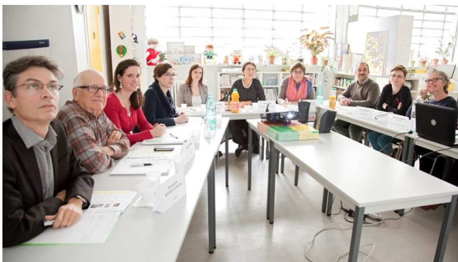
Les membres du jury au siège de l'association SPARADRAP