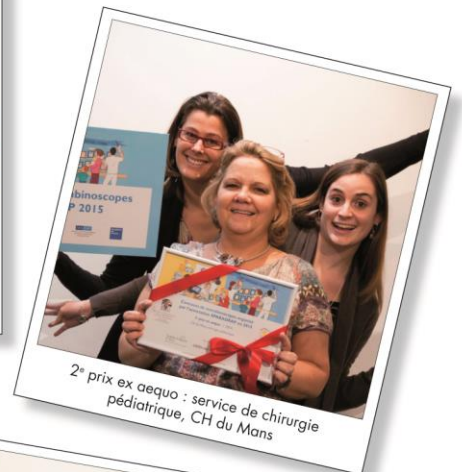
2 e prix ex aequo : service de chirurgie pédiatrique, CH du Mans