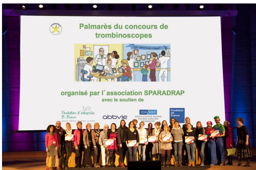
Les lauréats lors de la remise des prix à l'Unesco le 10 décembre 2015

Ce concours, organisé par l'association SPARADRAP de mai à octobre 2015, visait à favoriser un meilleur accueil des familles, grâce à la mise en place de trombinoscopes.