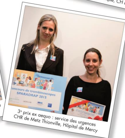
3 e prix ex aequo : service des urgences CHR de Metz Thionville, Hôpital de Mercy