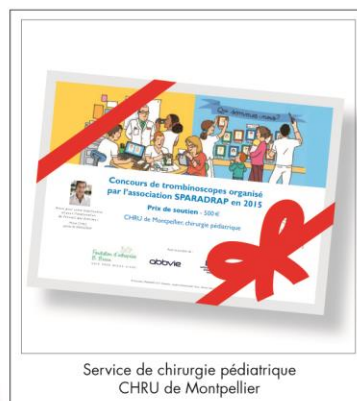
Service de chirurgie pédiatrique CHRU de Montpellier