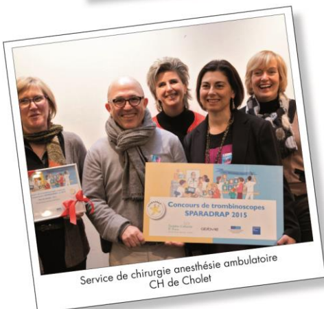
Service de chirurgie anesthésie ambulatoire CH de Cholet