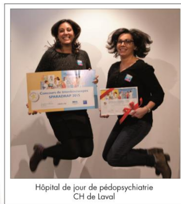
Hôpital de jour de pédopsychiatrie CH de Laval