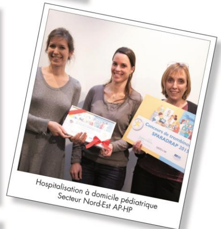
Hospitalisation à domicile pédiatrique Secteur Nord-Est AP-HP