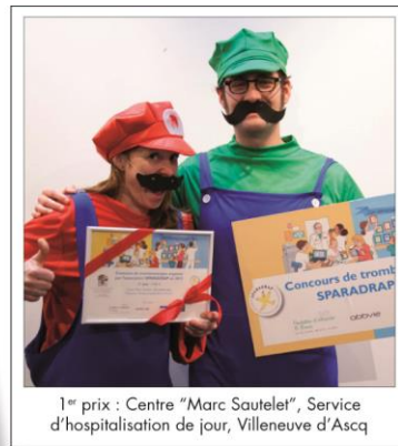
1 er prix : Centre "Marc Sautelet", Service d'hospitalisation de jour, Villeneuve d'Ascq