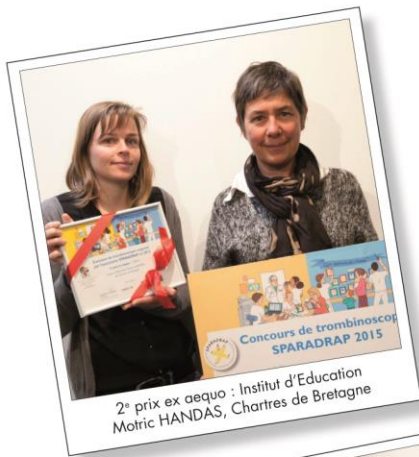
2 e prix ex aequo : Institut d'Education Motric HANDAS, Chartres de Bretagne