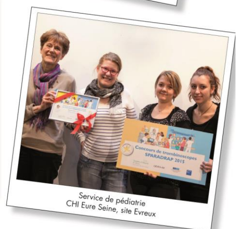
Service de pédiatrie CHI Eure Seine, site Evreux