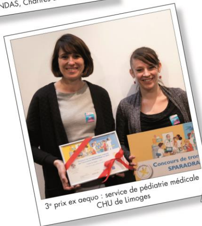
3 e prix ex aequo : service de pédiatrie médicale CHU de Limoges